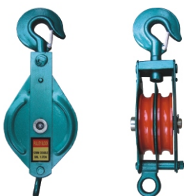
ДВОЕН НЕОТВАРЯЕМ БЛОК