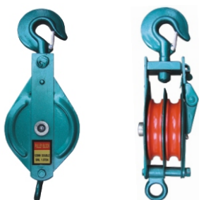
ДВОЕН ОТВАРЯЕМ БЛОК