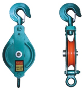
ЕДИНИЧЕН НЕОТВАРЯЕМ БЛОК